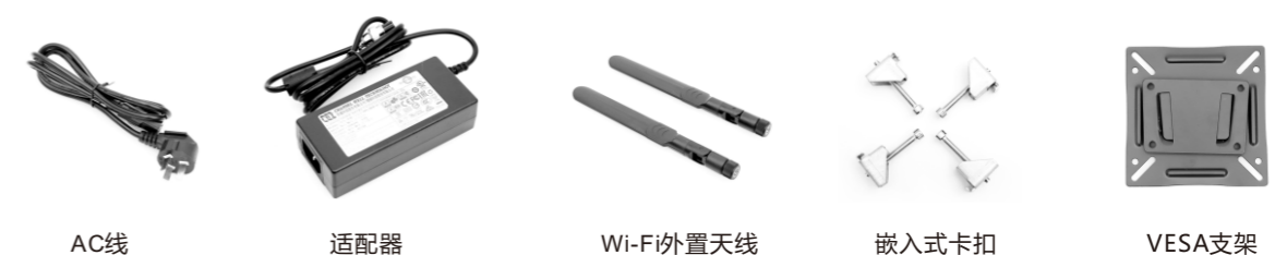
AC线 适配器 Wi-Fi外置天线 嵌入式卡扣 VESA支架