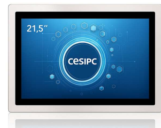
G 系列-21.5 寸全不锈钢 IP69K 工业平板电脑