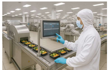
中央厨房-净菜加工车间