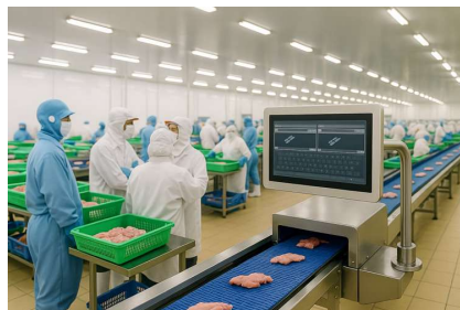
屠宰-生鲜加工中心