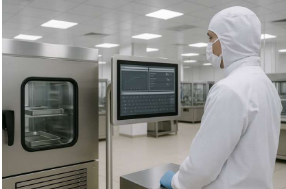
洁净实验室-环境试验仓