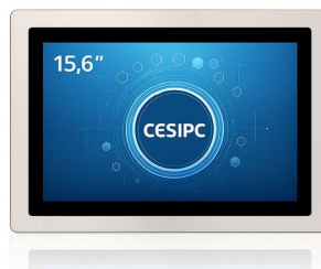
G 系列-15.6 寸全不锈钢 IP69K 工业平板电脑