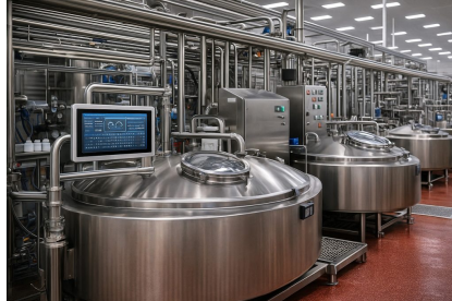
乳制品-饮料生产线