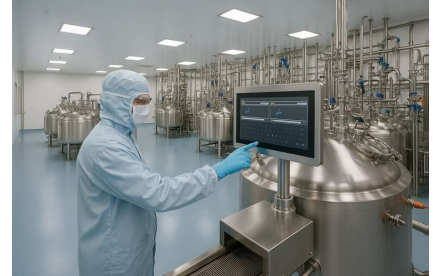
生物制药洁净车间