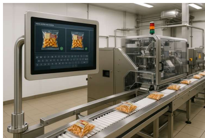
智能包装和视觉检测设备