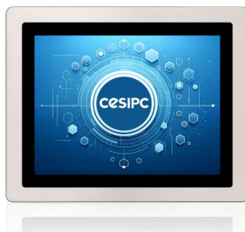
G 系列-15 寸全不锈钢 IP69K 工业平板电脑